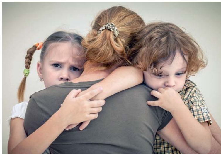
Na Charitu se často obracejí lidé, kteří do této doby žili zcela běžným životem.