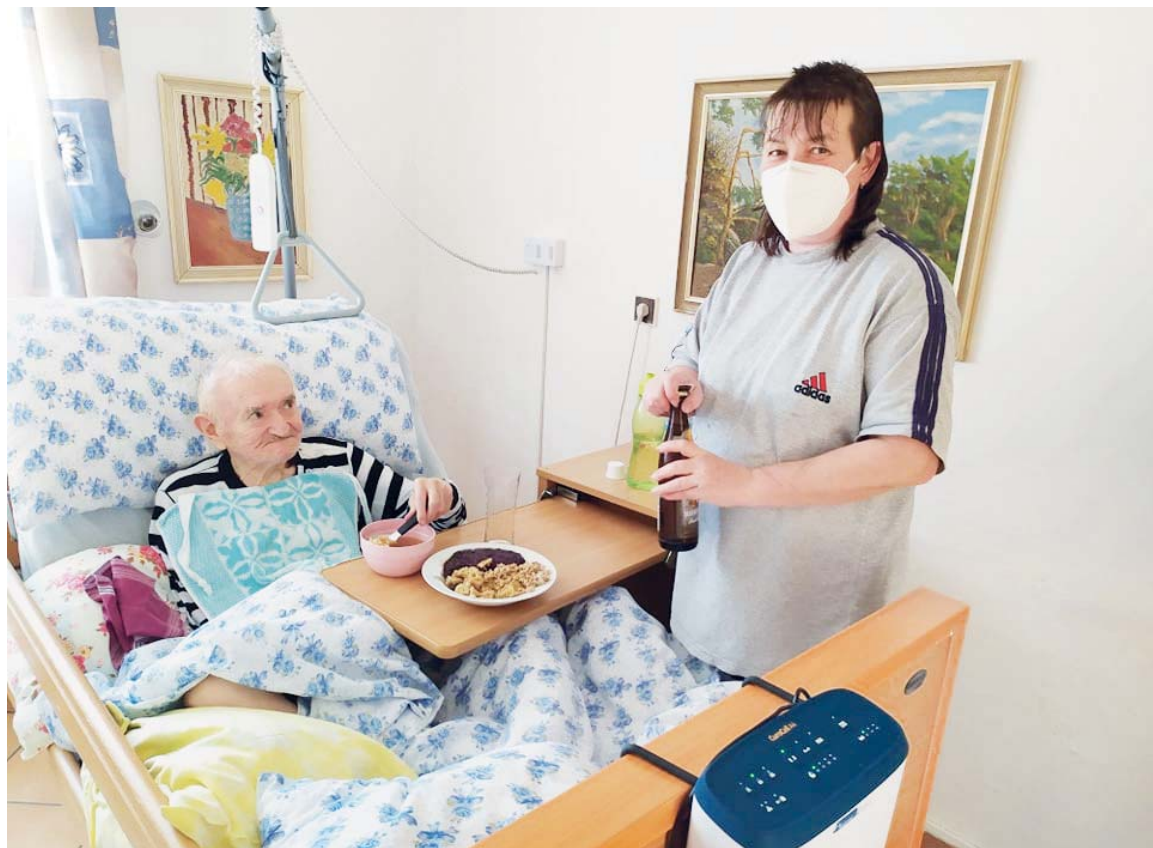
Klienti odmítali jíst i pít. Bylo nutné je různě motivovat. Třeba nabídkou dobrého piva k obědu.

„Psychický stav klientů nebyl dobrý. Z médií věděli, že situace je vážná a může pro ně skončit fatálně. Nebylo jim dobře, o to byli bolavější, úzkostnější, nejedli, nepili. Slibovali jsme jim řízky, zákusky, cokoli, jen aby něco snědli. Postupně naše síly ubývaly, zdravotní stav klientů se zhoršoval,