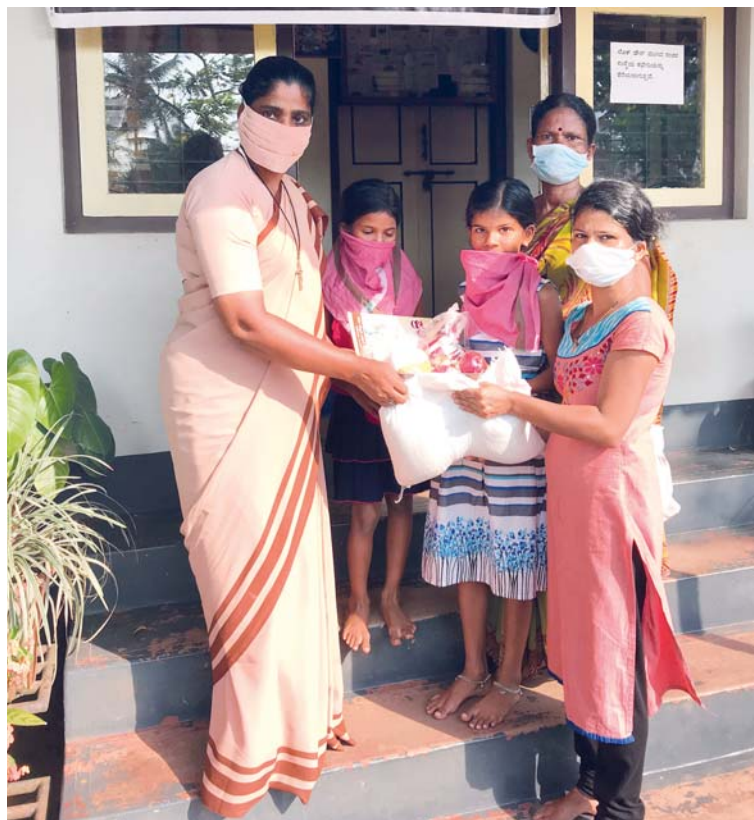
Chudé rodiny v indickém Mangalore podpořila Charita balíčky s jídlem. Najít však řešení koronavirové krize pro celý svět bude složitější, než je okamžitá potravinová pomoc.

V zemích, kde vládne chudoba, kde umírají stovky tisíc lidí na malárii, kde nemají fungující zdravotnictví a kde řada lidí žije v přeplněných slumech, není koronavirus na vrcholu agendy. Zároveň se téměř netestuje. Například nedávná studie Bostonské uni-