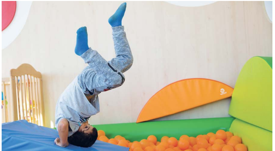
Některé děti zažívají už od mala, že životní kotmelce nebývají tak veselé jako ty při hře.

Když rodina dorazila do azylového domu, zdánlivě přehledná situace se rázem změnila. „Děti byly unavené a mezi partnery vládlo napětí. Maminka se najednou rozhodla ode-