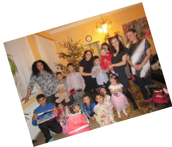
.....takové byly u nás Vánoce