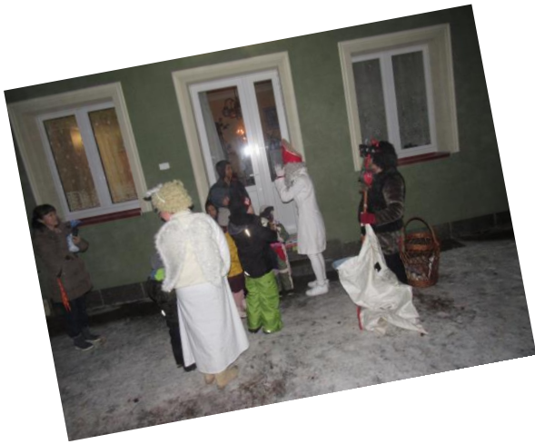
.....opět nás navštívil Mikuláš